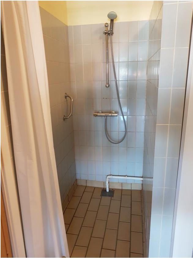
NY og indbydende herrer omklædning 16.11.2017